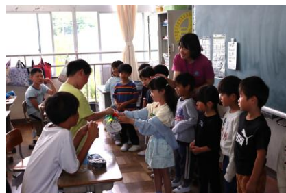
修学旅行、気をつけて行ってきてね