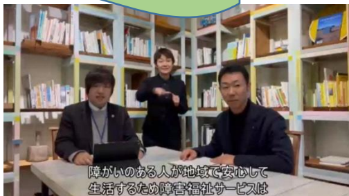
障がいのある人が地域で安心して 生活するため障害福祉サービスは

れいわ ねん がつ そうごうしえんほう かいせい 令和6年4月に総合支援法も改正されます。 こうせいろどうしやう ねん いちど しょうがいのあるひと ひつよう しえん じゆうがん 厚生労働省は、3年に一度、障がいのある人が必要な支援を十分 に受けられるように制度を見直しています。 かめおかしやう ふくしけいかく らいねんどあたらしやう 亀岡市障がい福祉計画も、来年度新しくなります。障がいのある人 が、暮らし方や働き方を自分で決められる、地域共生社会を 目指します。