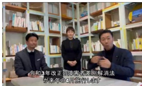
令和3年改正の障害者差別解消法 が来年の4月施行します

いま どりよくぎむ じぎょうしゃ ごうりてきはいりょ ていきょう 今まで努力義務であった事業者による合理的配慮の提供が、 来年4月から義務化されます。 合理的配慮とは、障がいのある人から、支援を求められた場合、 負担が重すぎない範囲で対応することです。 障がいのある人と対話をかさね、共に解決策を検討してることが 重要です。