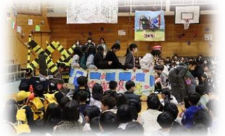
卒業列車に乗って各学年を回る6年生