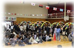
花道を通して退場する6年生