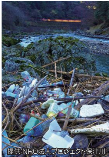
保津川の様子