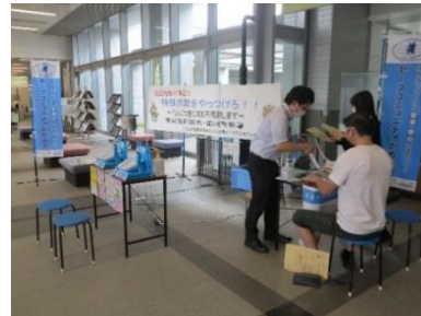
市役所1階エントランスホール出張受付