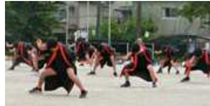
6年生:円陣 ～自分を信じ、仲間を信じ、未来へつなぐ～