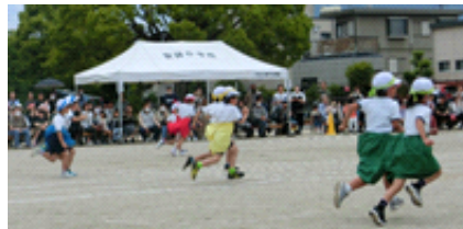
2年生:心を一につに よーいドン!!