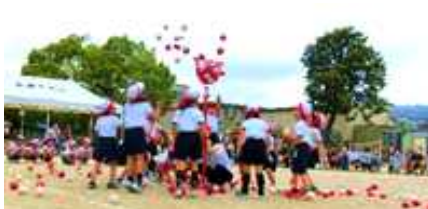
1年生:だいすき 玉入れ!!

5月20日（土）、参観運動会（体育科の授業参観）を行いました。多くの保護者の皆様にお越しいただき、子どもたちの頑張りに温かい応援の拍手をいただきました。仲間と協力して真剣に競技・演技する姿や最後まで諦めず走りきる姿に、子どもたち一人一人の成長を感じていただけたのではないかと思います。当日のお弁当の準備をはじめ、日々の体調管理や励まし、誠にありがとうございました。また、雨天のため、前日準備ができていない中、登校直後に保護者席等の設営を行った5・6年生のみなさん、ありがとう。