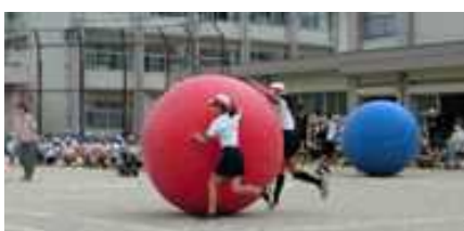
4年生:大玉 for YOU～つなげよう!ハピネス～