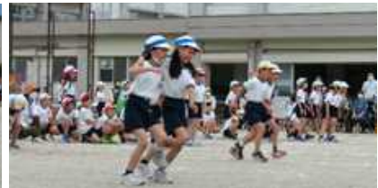
3年生:心と体をひとつに～二人三脚～