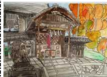
「秋の篠村八幡宮」 国際交流作品 5年

※この他にも複数、入賞がりましたが、紙面の都合上、上位入賞者のみ紹介しています。