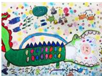
「まいごのモリーとわにのかばん」 特選 2年