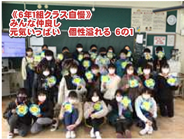
《6年1組クラス自慢》 みんな仲良し 元気いっぱい 個性溢れる 6の1