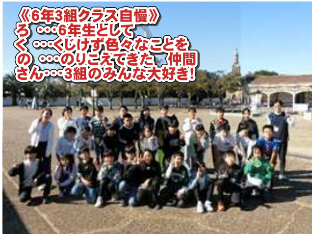
《6年3組クラス自慢》 ろ…6年生として く…くじけず色々なことを の…のりこえてきた 仲間 さん…3組のみんな大好き!