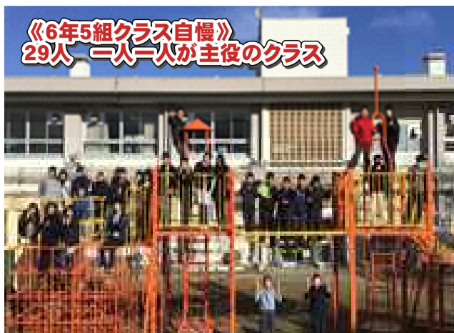
《6年5組クラス自慢》 29人 一人一人が主役のクラス