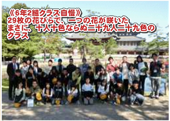
《6年2組クラス自慢》 29枚の花びらで、三つの花が咲いた まさに、十人十色ならぬ三十九人三十九色の クラス