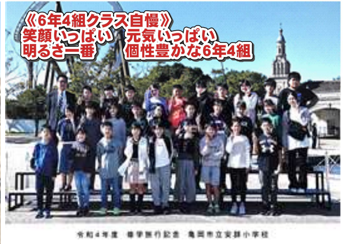
《6年4組クラス自慢》 笑顔いっぱい 元気いっぱい 明るさ一番 個性豊かな6年4組