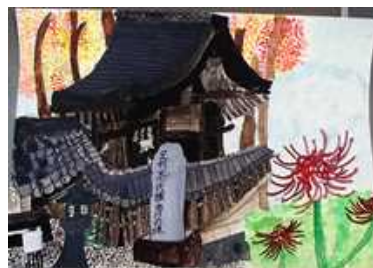
「秋の篠村八幡宮」 特選 5年