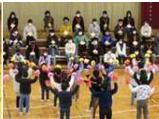
1年生 6年生！だいすき！！