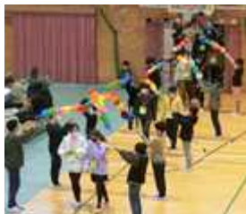
花のアーチをくぐって、笑顔で入場の6年生

この1年間、「花～Change for the Better～」を合い言葉に、全校をよりよくするために考えて行動してきた6年生。そんな6年生にありがとうの気持ちを伝えようと、どの学年も心を込めて発表をしました。6年生からも各学年に温かいメッセージがあり、在校生も胸がいっぱいになりました。最後に6年生が感謝の想いを込めて歌った「未来へ」は会場の5年生、保護者の皆様の心にしみ入りました。準備を進めてきた5年生、ありがとう。6年生からのバトンを受け取り、全校のために頑張っていこうという気持ちが伝わる頼もしい姿でした。