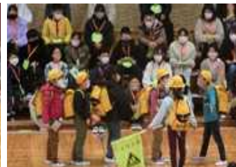
2年生 さっすが6年生 パワー！！