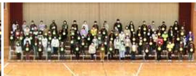
6年生 6年間の思い出を大切に、歩いていきます ～未来へ～