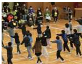
4年生 6年生！ プラボー！！