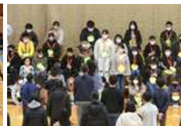
5年生 私たちが引き継ぎます！！