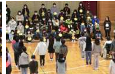
3年生 フレーフレー6年生 ゴー！ゴー！ゴー！