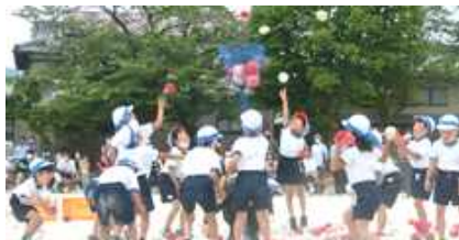
1年生:スマイル 玉入れ!!

5月21日（土）、参観運動会（学年体育の授業参観）を行いました。新型コロナウイルス感染症対策のため、今年度も様々な制約の中での取組となりましたが、多くの保護者の皆様にお越しいただき、子ども達の頑張りにより温かい応援の拍手をいただきました。仲間と協力して真剣に競技・演技する姿や最後まで諦めず走りきる姿に子ども達一人一人の成長を感じていただけたのではないかと思います。当日のお弁当の準備を始め、日々の体調管理や励まし、誠にありがとうございました。 ※3年生は6月6日（月）に開催予定です。