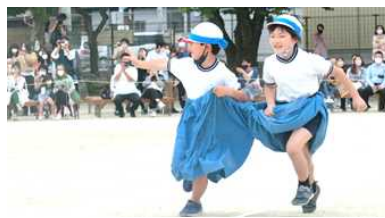
2年生:それいけ!でかパンマン ～なかよし100%～