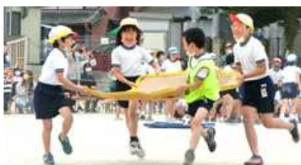
4年生:みんなといっしょにゴーール!!