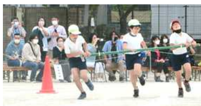
5年生:シン・台風の目