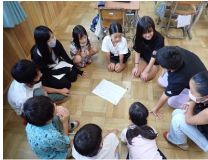
【なかよし班では、6年生が考えたゲーム等を行います】

また、このソーシャルスキルを高めるために、なかよし班(縦割り班)での活動をします。「自分と友達の気持ちは違うこと」や「場に応じた言葉を使うこと」等を活かして、異年齢の仲間とも前向きなつながりをつくってほしいです。