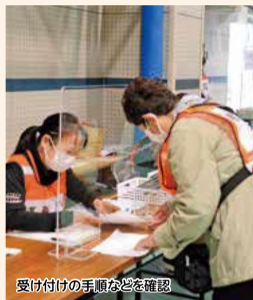
受け付けの手順などを確認