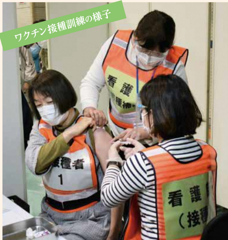
ワクチン接種訓練の様子