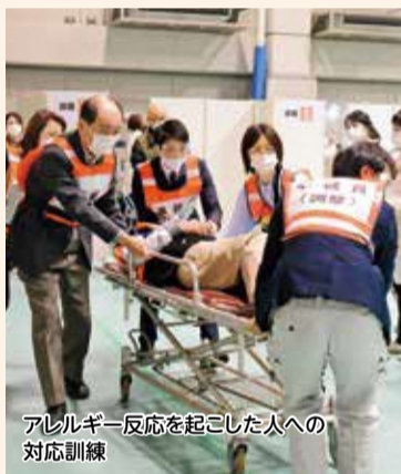
アレルギー反応を起こした人への対応訓練