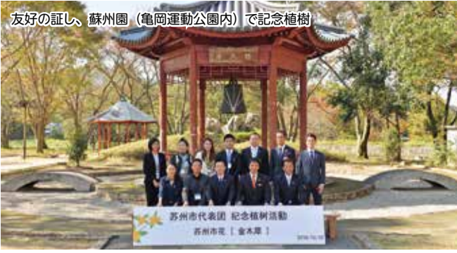
友好の証し、蘇州園(亀岡運動公園内)で記念植樹

10月20日から23日にかけて、桂川市長と湊市議会議長が、亀岡市と友好交流都市盟約を締結している中華人民共和国江蘇省、蘇州市を訪問。これは、南京市で開催された江蘇省の国際友好都市40周年記念式典に、蘇州市の友好交流都市として出席したものです。