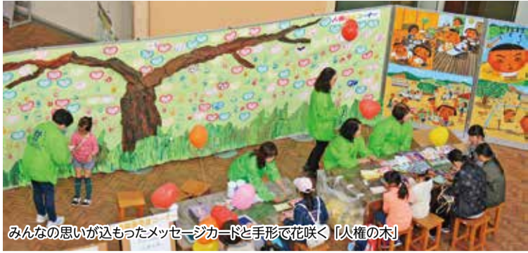
みんなの思いが込められたメッセージカードと手形で花咲く「人権の木」