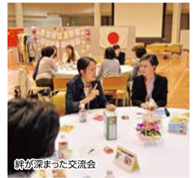
絆が深まった交流会

なお、両市の友好の証しである「蘇州園」(亀岡運動公園内)において記念植樹を行ったほか、丹波亀山城址や