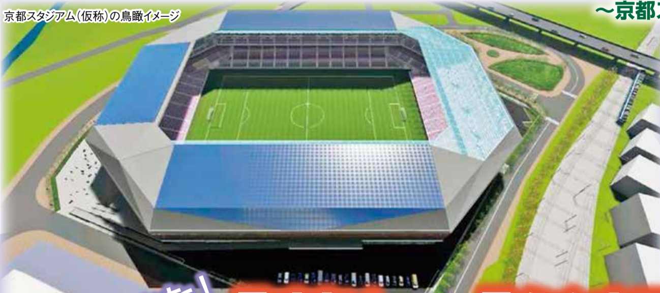
京都スタジアム(仮称)の鳥瞰イメージ

ホームページ http://www.city.kameoka.kyoto.jp 電子メール office@city.kameoka.lg.jp フェイスブック http://www.facebook.com/kameokacity