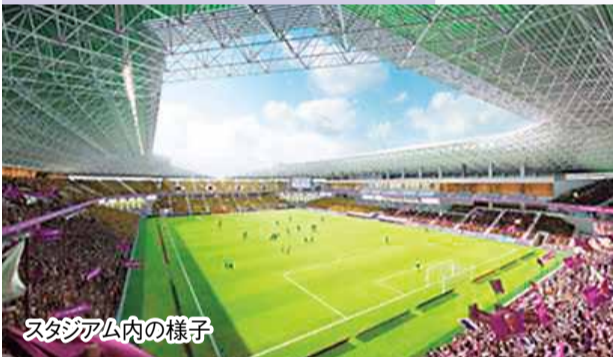
スタジアム内の様子

南側にJR亀岡駅、北側に保津川下り乗船場が位置し、府道亀岡園部線の高架橋が隣接しています。建築面積は約1万5,500平方メートル、延床面積は約3万3,000平方メートル、地上4階、高さ約28メートルの鉄筋コンクリート一部鉄骨造の構造になっています。屋根には周りの山並みと調和する勾配がつけられ、印象的