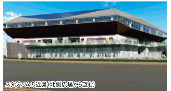
スタジアムの近景(北側広場から望む)