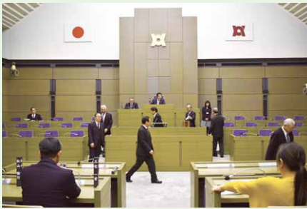
選挙(投票)の様子 (議場)