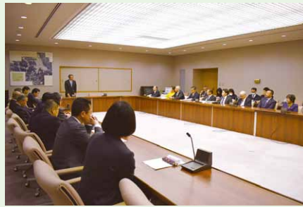
立候補者が所信表明 (全員協議室)

選挙に先立ち、立候補者は、他の議員の前で所信表明を行い、議会改革やまちづくりに対する思いを表明しました。