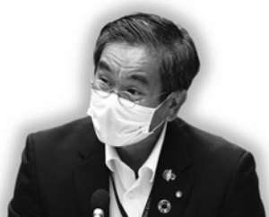
三宅 一宏 議員

三宅 年間5億円近いばこ税を財源とし、その内の1%を使用し、5年計画で、JR千代川駅、並河駅、馬堀駅、トロッコ亀岡駅にも1カ所ずつ喫煙ブース