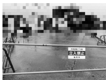
市が対策を行った市有地

市長 車両所有者に対し、強く撤去を促し、最終的には、法的な手続を視野に入れながら解決を目指す。