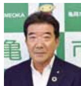
また、5月臨時会では、議員の6月の期末手当を2割削減すること

6月議会には、主に新型コロナウイルス感染症対策関連の補正予算や報告議案が提案されました。それらは、新型コロナウイルスに立ち向かい、市民の皆さんを応援するため、市民の皆さんが随所に盛り込まれたものであります。議会としても、十分に慎重な審査を行い、各議案を全員賛成で可決したところです。