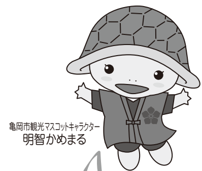
亀岡市観光マスコットキャラクター 明智かめまる