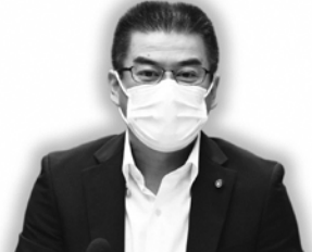
浅田 晴彦 議員

浅田 自然災害に対する取り組みとして、ハザードマップや防災ガイドブック、新型コロナウイルス感染症予防に考慮し避難を求めるチラシが全戸配布された。コロナ対策で活動や行事が中止・延期になっている消防団に、亀岡市内の家屋を含めた、危険指定箇所の点検や地域の警戒・見回り、また広報・啓発活動などを自主的な活動として協力してもらい、市民の安心・安全確保に向けた、取り組みを考えてもらえないか。