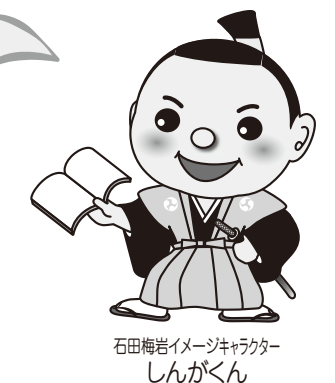
石田梅岩イメージキャラクター しんがくん

そっだよ。6月議会は、5月1日に開催された臨時会とともに コロナから市民を守り 応援する予算を決めたんだ。