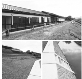
桂川舟運歴史体験・展示施設及び護岸、船着場

下、現地確認を行い追加整備が必要と考え、京都府に管理運営に関する要望書を提出した。