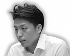
松山 雅行 議員