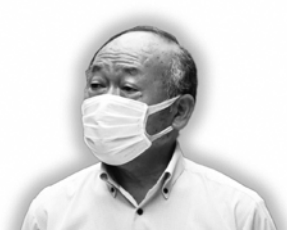
田中 豊 議員

田中 新型コロナウイルス感染症は完全に収まっておらず、次の感染の波がいつ、どのように起きるか予断を許さない。今、自然災害が発生したら、避難先でどう感染予防をするのかという心配がある。4月1日に指定避難所が発表された。災害時の避難所における新型コロナウイルス感染症対策の取り組みはどうか。