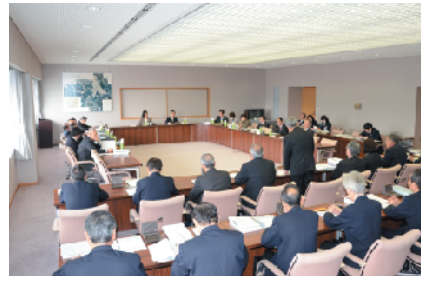
予算特別委員会による審査(3月16日)