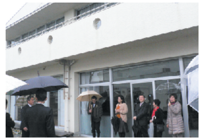
馬路児童館への現地視察(3月23日)