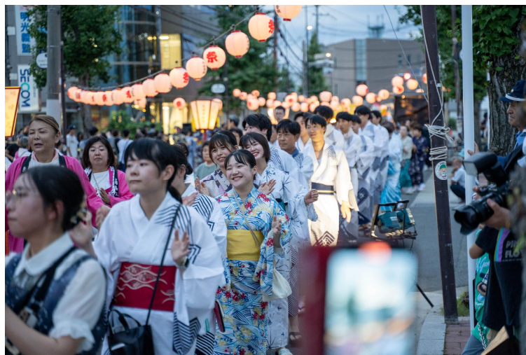
(大踊り大会当日の様子)

丹波音頭・踊り保存会では、令和8年8月6日(木)に亀岡駅南側(市道紺屋停車場線)にて大踊り大会を実施いたします。口丹波地方の郷土芸能である丹波音頭・踊りの保存、継承を目的に実施し、市民のふれあいの場、生涯学習の場として毎年たくさんのご参加をいただいています。