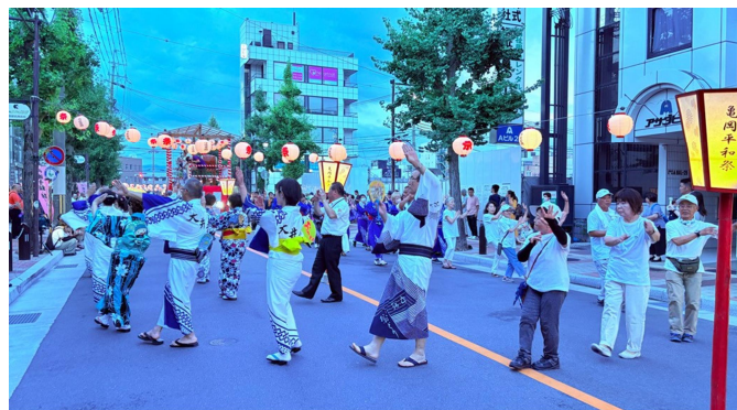
(輪になって踊る様子)

大踊り大会は、音頭台を中心に写真のような輪を作り、音頭に合わせて踊ります。大会後半には、豪華賞品が贈られる踊りコンテストも実施いたします。そのほか、飲食ブースや、明智かめまるとの写真撮影会、お楽しみ抽選会を実施いたしますので、お子様や踊りが苦手な方でもお楽しみいただける内容となっております。