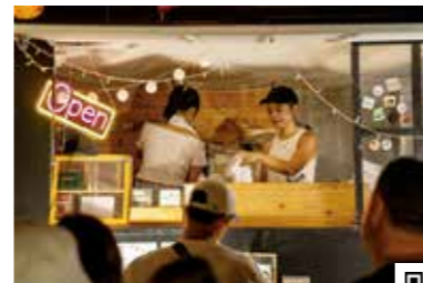
大踊り大会にはマルシェも登場。