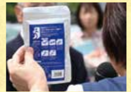
弾性ストッキング