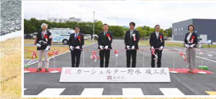
▲竣工式では、関係者が喜びのテープカット

近年、災害の激甚化もあり、避難生活の長期化やプライバシー確保の重要性が高まっています。こうした課題に対応するため、吉川町穴川地区に市内初となる車中避難場所「カーシェルター野水」を整備し、5月23日に竣工式を行いました。 当日は式典に加え、施設見学も行われ、防災への意識を高めました。