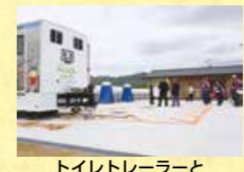
トイレトレーラーとマンホールトイレ

「地域の防災拠点となる「防災資機材倉庫」」 災害時に必要な物資や資機材を保管します。健康面に配慮し、車中避難で懸念されるエコノミークラス症候群を予防するための「弾性ストッキング」(着圧ソックス)なども備蓄しています。