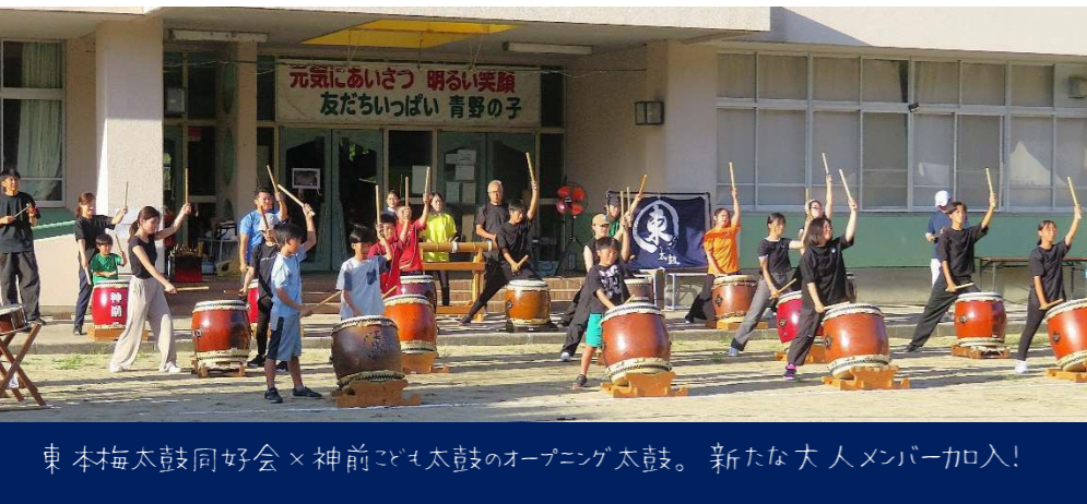
東本梅太鼓同好会×神前こども太鼓のオープニング太鼓。新たな大人メンバー加入!

青のたすきでは行きつけの森づくり・竹活用WS・野菜収穫など、いつもの景色を少し面白くする活動をしています。 地域にこだわって活動することで、自分たちが住む場所を自分たちの手で面白くしたいと願っています。