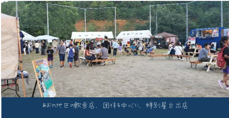
あおの地区の飲食店、団体を中心に、特別屋台出店