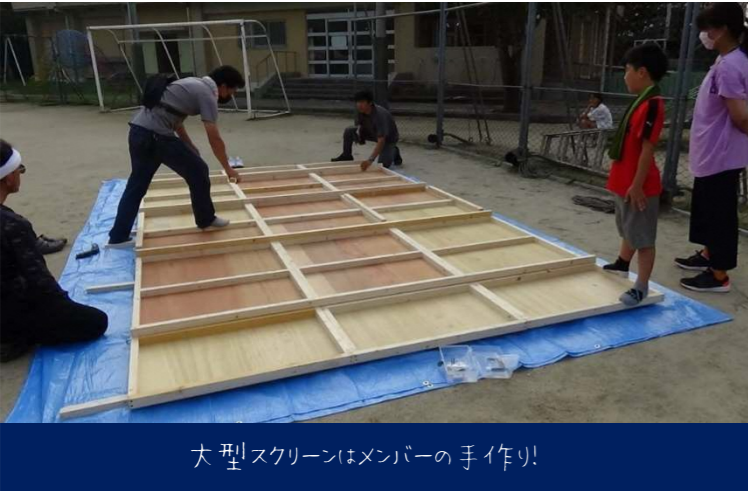
大型スクリーンはメンバーの手作り!

今回は晴天で、まさに星空映画館でした! 来場者数は397人。 ボランティア含め約500人が青野小学校に集まり、夏の終わりのひと時を一緒に過ごすことができました!!