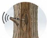
打音データを取得