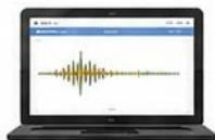
AIが内部を解析・判定