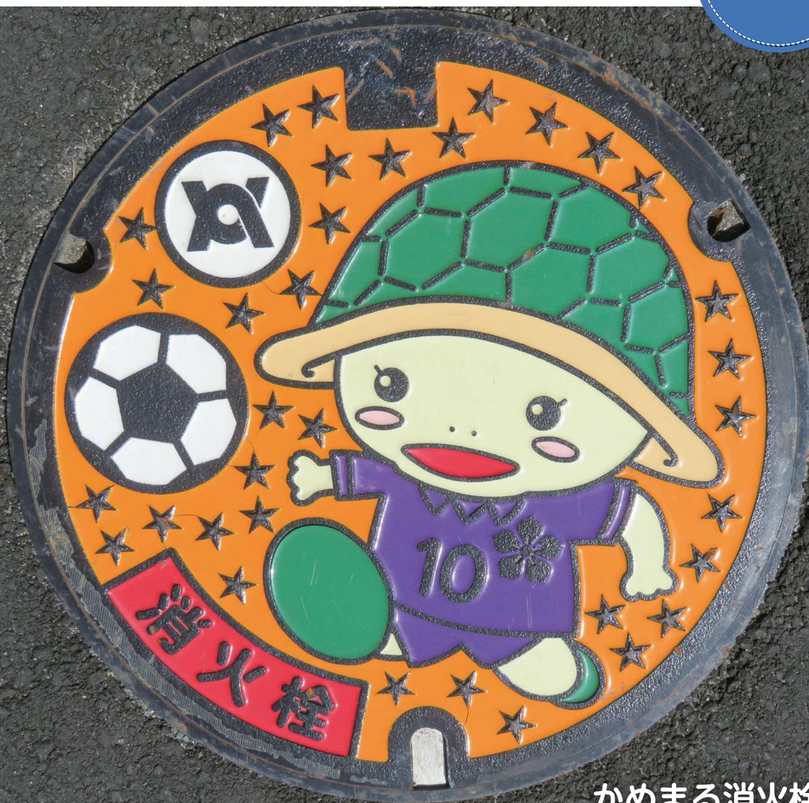
かめまる消火栓ふた