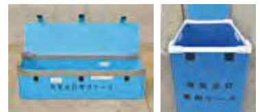
蛍光灯回収のボックス