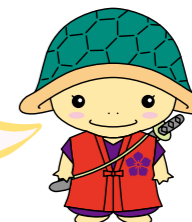
亀岡市観光マスコットキャラクター 明智かめまる