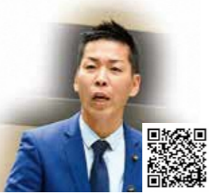
山木 裕也 議員

山木 丹波国分寺跡は、奈良時代に建立された巨大寺院跡であり本市における歴史の原点である。一方、全体像が分かりにくく、その価値が十分に伝わっていない。全国都市緑化フェア