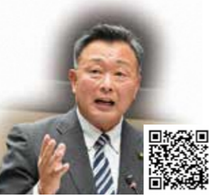
三上 泉 議員

三上 亀岡駅以北の減便解消、全駅でのICカード対応改札、改札内トイレの洋式化などは急務。実現すべきでは。また、駅前駐輪場の修繕や精算機更新の進捗状況は。