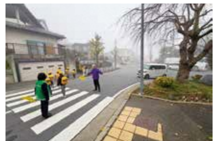
つつじヶ丘56号線交差点

総務部長 事故リスクは認識しており、警察と連携し歩車分離信号の設置について協議を進めていく。