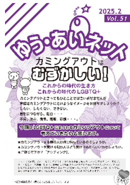
ゆう・あいネットVol. 51 (令和7年2月17日発行)