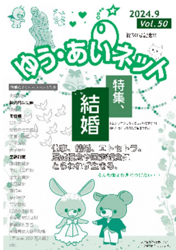
ゆう・あいネットVol. 50 (令和6年9月17日発行)

ジェンダー平等に関心のある人、情報紙づくりに興味がある人、文章やイラストをかくことが好きな人など、あなたが今気になっていることや、伝えたいことを記事にしてみませんか。