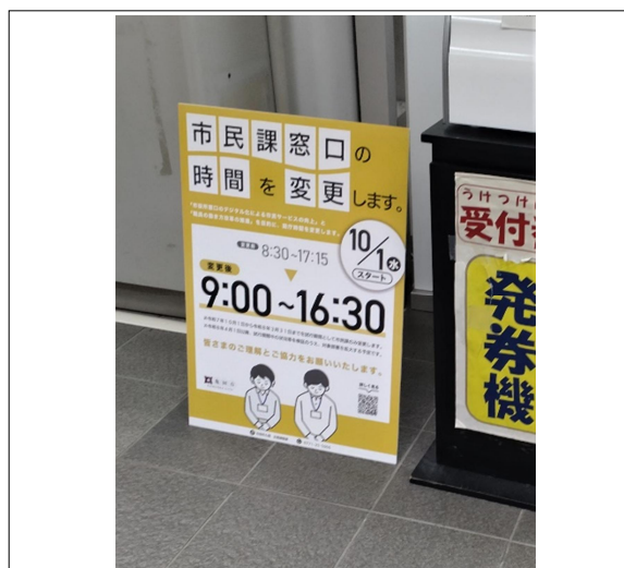
(市民課では試験的に窓口短縮を実施中)