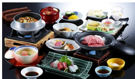
湯の花温泉旅館『松園荘』

茨木市亀岡市の広域観光連携記念ツアーの第1弾は、サスペンスツアー！大阪府茨木市にある『GRAVITATE OSAKA』の日本一長い吊り橋や、京都府亀岡市の湯の花温泉の『松園荘』が舞台となっています。LINEアプリを使用し、参加者それぞれに設定書が用意されており、その設定に基づいて行動する為、サスペンスツアーを体験したことがない方も楽しめる仕様となっています。1日目は朝に大阪駅から始まり、茨木市の『GRAVETATE OSAKA』の日本一の吊り橋を体験でき、夜は亀岡市の『松園荘』で湯の花温泉や料理を楽しみながら推理をしていただけます。