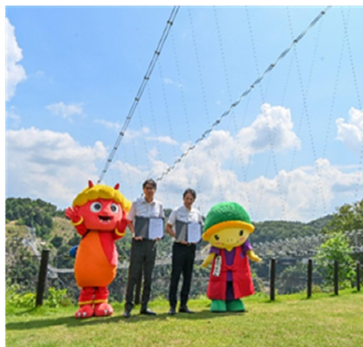
協定書を持つ両市長と両市のマスコットキャラクター

令和 7 年 8 月 20 日(水)、京都府亀岡市と大阪府茨木市で広域観光連携に関する協定を締結しました。同協定により、両市の異なる観光資源を連携させ、イベントの開催や周遊ツアーの造成など、共同でプロモーションを実施する予定です。年間約 300 万人の観光客が訪れる亀岡市は、「保津川下り」や「湯の花温泉」といった歴史・自然に関連する観光資源があり、隣接する茨木市では、2025 年 3 月に日本最長の歩行者専用吊り橋を持つ体験型施設「GRAVITATE OSAKA」がオープンしました。同協定は、相互に補完可能な観光資源を結びつけ、新たな広域周遊ルートを形成することを目的としており、今回のサスペンスツアーは茨木市亀岡市観光提携記念ツアーの第 1 弾となっています。