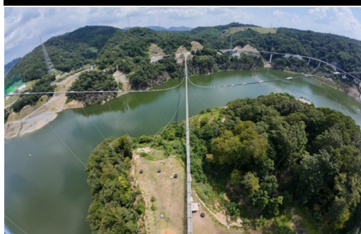
日本一の長さ吊り橋『GRAVITATE OSAKA』