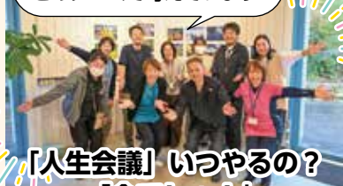
「人生会議」いつやるの？ 「今でしょ！」