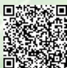
記録用シート 「わたしの想い」はこちら

話し合ったことを記録したら、お薬手帳に挟んだり、ポーチなどに入れて分かりやすい場所で保管しましょう。