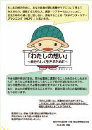
人生会議 記録用シート 「わたしの想い」

皆さんの想いを書き留めるためのシート 「亀岡市版ACP」わたしの想い」を作成しています。