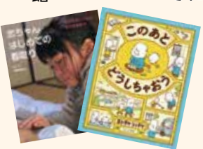
▲(右) このあと どうしちゃう？ 作：ヨシタケ シンスケ 出版：プロズ新社 (左) 恋ちゃんはじめての看取り おばあちゃんの死と向き合う 著者：國森 康弘 文・写真 出版：農山漁村文化協会（農文協）

図書館では、今回の特集に合わせて企画展示を行っています。 特別企画 「わたしの人生 どうしちゃう？」 中央館、大井分館、ガレリア分館、馬堀分館 1月末日まで