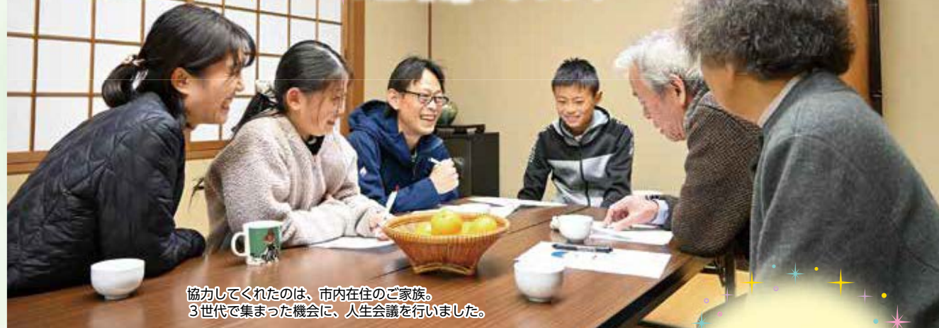
協力してくれたのは、市内在住のご家族。 3世代が集まった機会に、人生会議を行いました。

「誰もがいつか亡くなる」 —もしもの時、あなたの想いを 周りの大事な人に伝えるために 人生会議があります