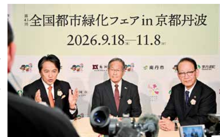
▲首長対談収録の様子

また、京都丹波にお越しいただき、感じた 「緑の大切さ」を都市部に持ち帰ることで「み どり豊かなまちづくり」を推進していくとい う、これまでのフェアとは異なる「都市緑化 を形づくりまします。 いよいよ開催年を迎え、主催する2市1町 の首長が集まり、みどりの里まつり開催に 取り組む決意を表明し、今後の取り組みに 取り組む決意を表明し、今後の取り組みに 取り組む決意を表明し、今後の取り組みに