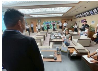
議長室などを探検

8月5日に亀岡市議会議場などにおいて「子ども議場見学会」を開催し、未 来の亀岡市を担う15名の小学生が応 募し、参加していただきました。