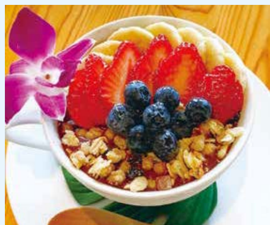
▲アサイボウルもおすすめ