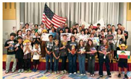
▲ホストファミリーとの対面式