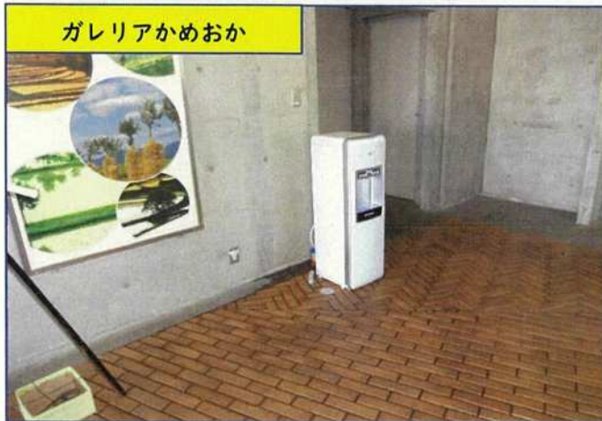
ギャラリーかめおか