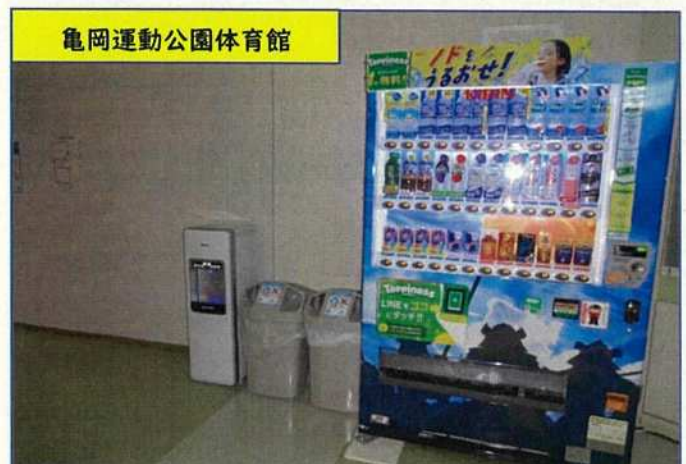
亀岡運動公園体育館