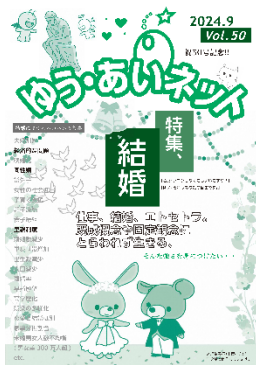
ゆう・あいネット Vol. 50 (令和6年9月17日発行)

ジェンダー平等に関心のある人、情報紙づくりに興味がある人、文章やイラストをかくことが好きな人など、あなたが今気になっていることや、伝えたいことを記事にしてみませんか。