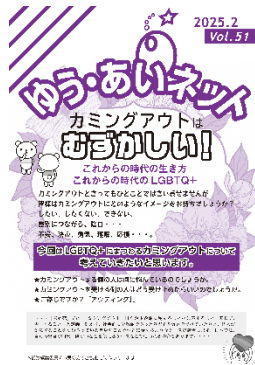
ゆう・あいネット Vol. 51 (令和7年2月17日発行)