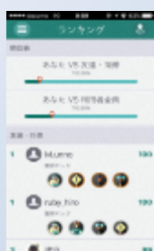
ランキング・バッジ獲得