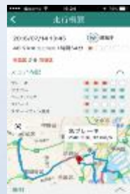
安全運転のヒント