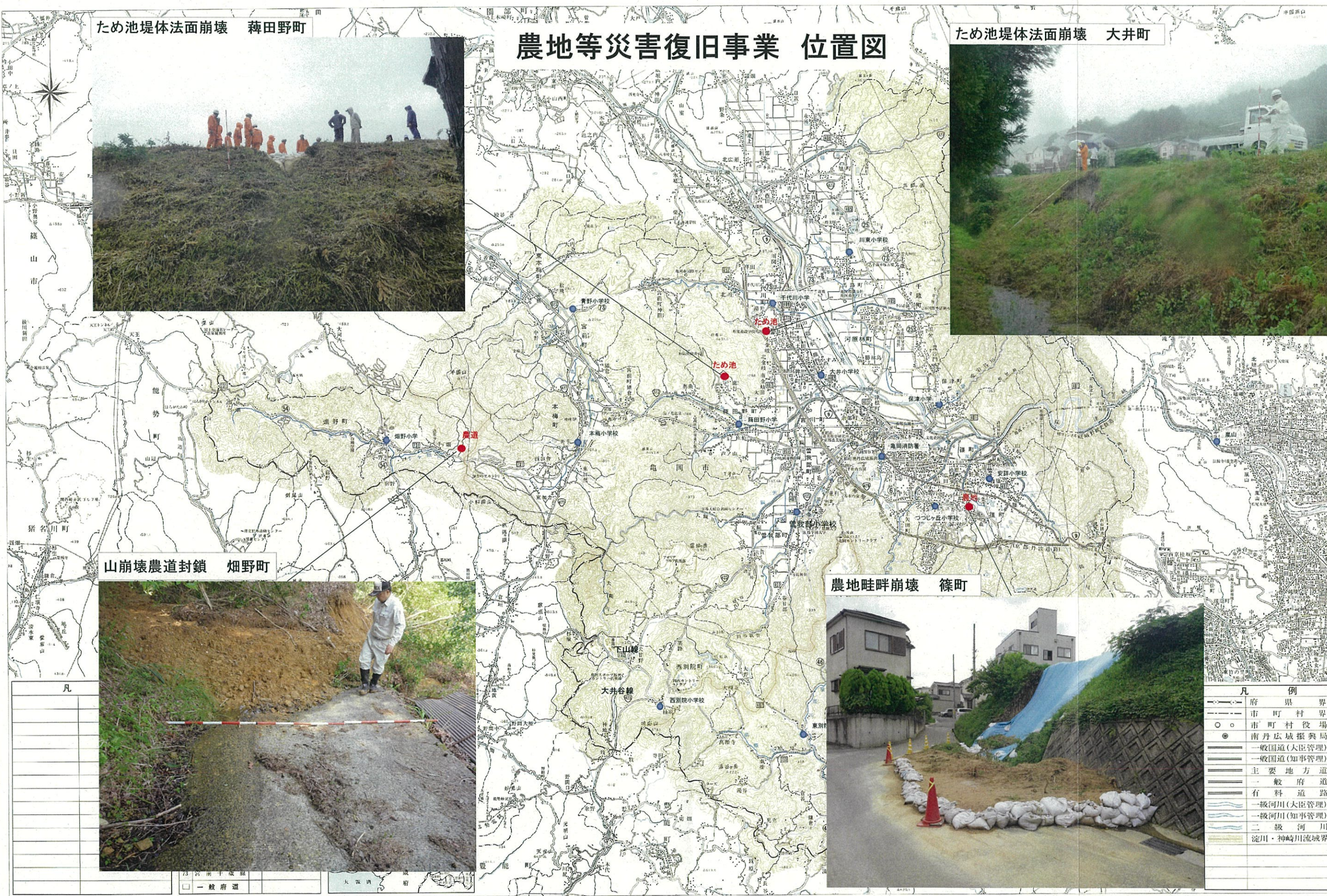
山崩壊農道封鎖 畑野町