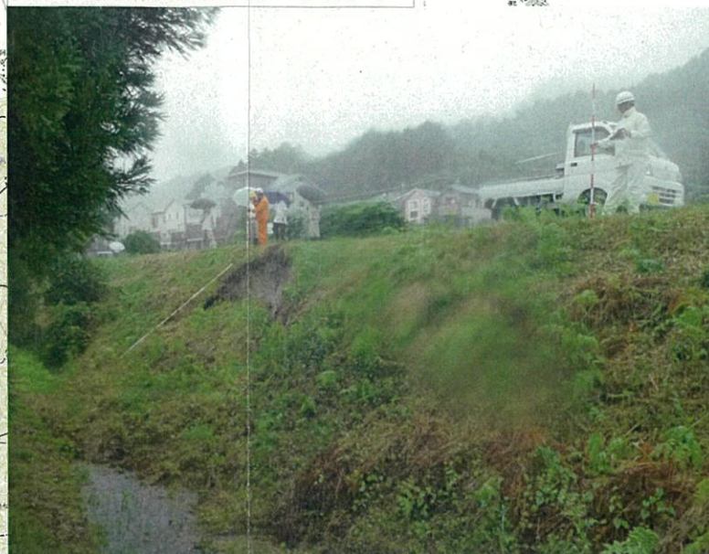
ため池堤体法面崩壊 大井町