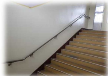
(階段に手すりを設置)