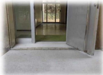
(配膳ワゴンのための段差の解消)