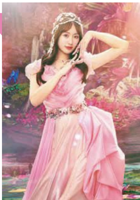
ささき あやか 佐々木 彩夏 ニックネーム:あーりん ももクロのアイドル

百田夏菜子、玉井詩織、佐々木彩夏、高城れにの4人からなるアイドルグループです。2008年に結成され、2010年5月にシングル「行くぜっ！怪盗少女」でメジャーデビュー。2012年にはグループ結成当初から目標としていた「NHK 紅白歌合戦」に初出場し、2023年5月に15周年を迎え、今年5月にはニューアルバムをリリースします。