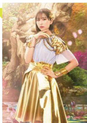
たまい しおり 玉井 詩織 ニックネーム:しおりん ももクロの若大将