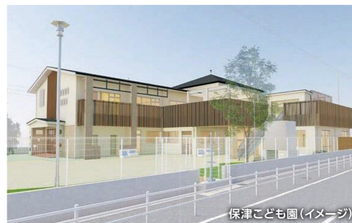
保津こども園(イメージ)