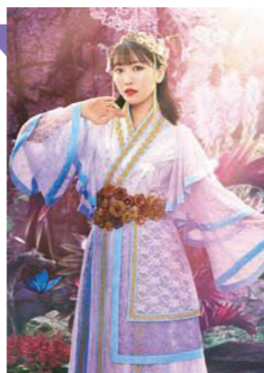
たかぎ れいこ 高城 れに ニックネーム:れにちゃん ももクロの鋼少女