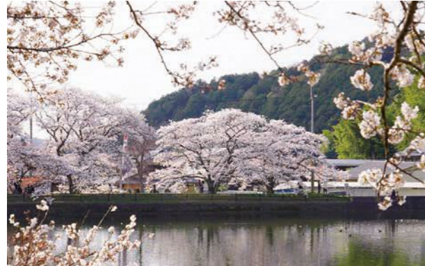
▲桜が咲く時期に行われる行事のイメージが、入学式だったり卒業式だったり、世代によって異なるかもしれない

入学式や入社式など、4月は新たな門出を祝う行事が各地で開かれます。市内でも、七谷川沿いの「和らぎの道」や平の沢公園などで、満開の桜を楽しむ人の姿を目にしますが、その季節が早まっているように感じる人もいないのでしょうか。