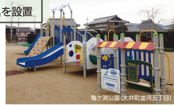
亀ヶ淵公園(大井町並河五丁目)

インクルーシブ遊具とは障がいの有無や年齢に関係なく、誰もが楽しめる遊具のことです。 亀岡市内の都市公園で初めて、大井町並河五丁目の亀ヶ淵公園にインクルーシブな大型複合遊具を導入しました。 みんなが滑れるワイドなスライダーや車いすに乗りながら遊べるパネルなどたくさんの遊びを詰め込んだ遊具が設置されています。