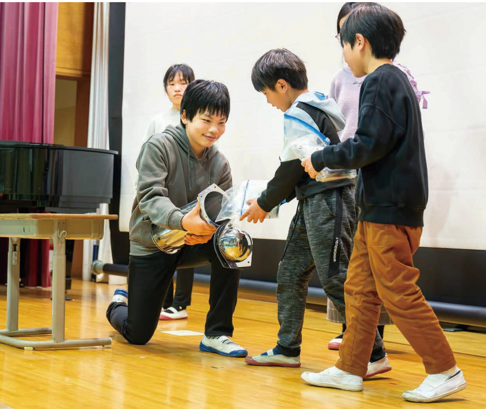
タイムカプセルに思い出を詰める子どもたち(青野小学校閉校記念集会)