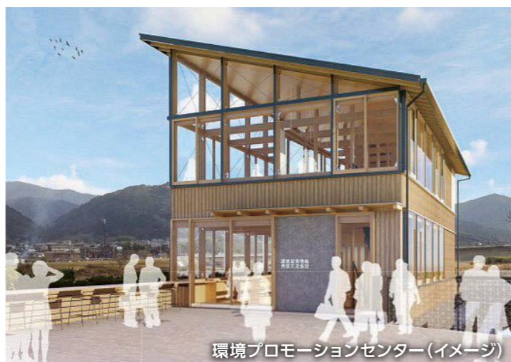
環境プロモーションセンター(イメージ)