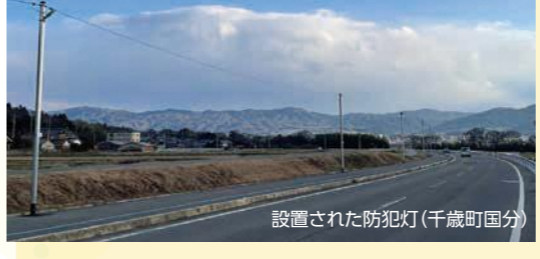
設置された防犯灯(千歳町国分)

設置区間は、千歳町国分地内の府道亀岡園部線です。視認性がよくなることで、歩行者や自転車の夜間の安全な通行や犯罪防止につながる事が期待されます。