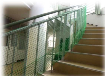
（落下防止ネットの設置）