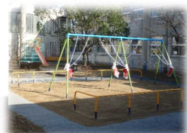
（中庭に遊具を設置）