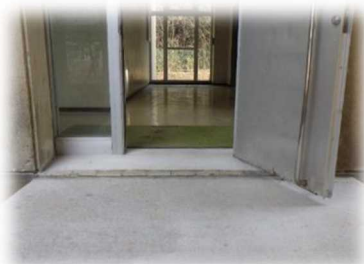
（配膳ワゴンのための段差の解消）