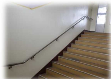
（階段に手すりを設置）