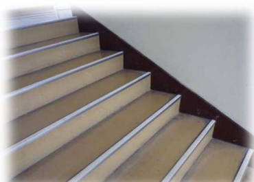
（階段の滑り止めの改修）