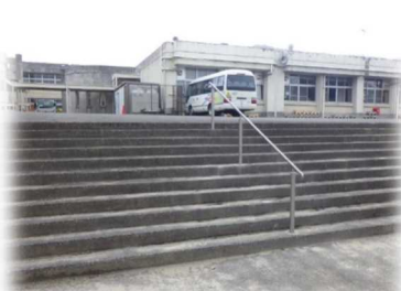
（グラウンドへの階段に手すりを設置）