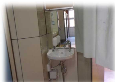
（低学年用手洗いの設置）