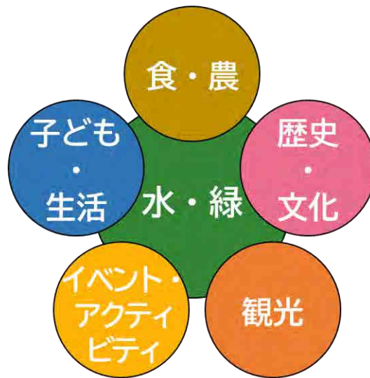
図 亀岡市のまちづくりを検討するうえで重要と考える視点