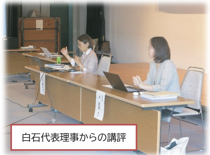
白石代表理事からの講評