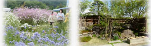
コスモス園と連携した華やかな修景の中で多彩な提案に触れ、学ぶことができる出展を展開