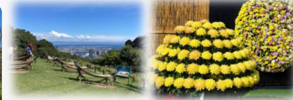
京都丹波地域の眺望を楽しむ場や、高い園芸技術に触れ、学ぶことができる出展を展開