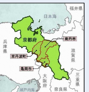
図 開催地域位置図

開催時期は2026(令和8)年の9月中旬～11月上旬をコア期間とし、コア期間以外でも、京都丹波地域の様々な歳時と積極的に連携し、地域の魅力を伝えていく。