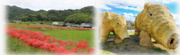
日本の原風景の美しさを伝える展示や農の価値を再発見するためのコンテンツを展開