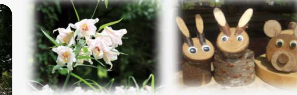
京都丹波地域の豊かな植物と、心を豊かにする文化・芸術とが融合した展示や山野草をテーマにしたコンテンツを展開