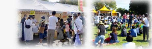
地域の食を満喫できる場や多彩なイベントを展開