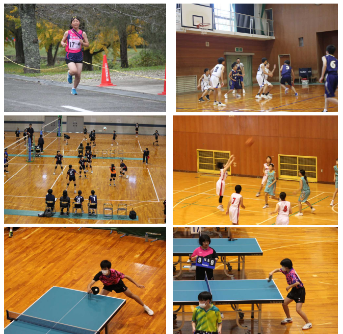
【結果】卓球 男子団体 第3位

府駅伝に女子チームが出場しました。地区予選を突破した30チームが近畿・全国を目指して力走しました。出場したみなさんにとって、大変よい機会となりました。また、各種口丹新人大会も行われました。大会での成果と課題を来年にぜひ活かしてください。