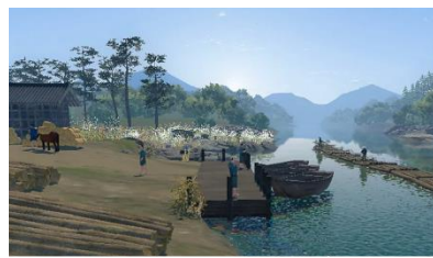
保津川(ほづがわ) 水運や生きものについて学ぼう!