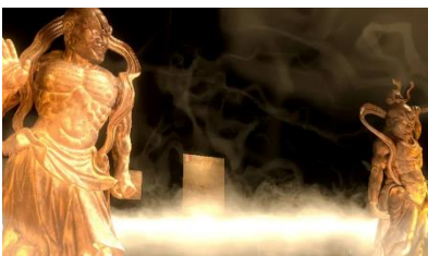
霧の宝物殿(きりのほうもつでん) ふるさとの仏像たちを見てみよう!