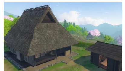
棚田の村(たなだのむら) 農村のくらしをのぞいてみよう!