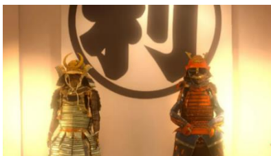
丹波亀山城(たんばかめやまじょう) 明智光秀(あけちみつひで)が建てたお城について学ぼう!