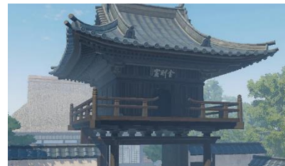
福寿山金剛寺(ふくじゅさん こんごうじ) 円山応挙(まるやまおうきょ)の絵を見てみよう!