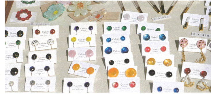
※写真は昨年開催時のものです