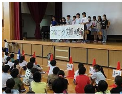
【久しぶりに全校で集まった児童集会】

保護者の皆様には予定の変更や制限など、ご不便をお願いすることもあるかと思いますが、子どもたちの経験や達成感を大切に進められますよう、ご理解・ご協力をお願いいたします。