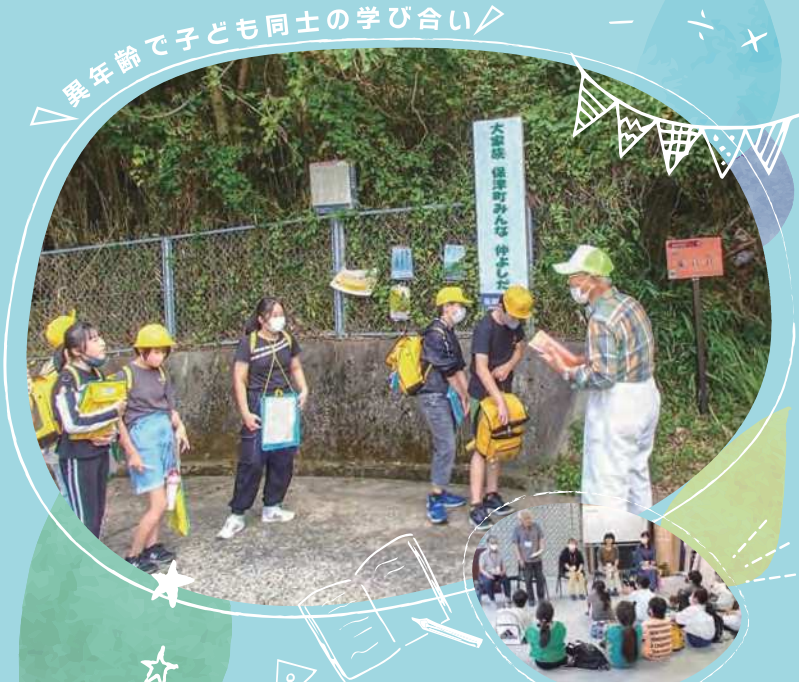
異年齢で子ども同士の学び合い