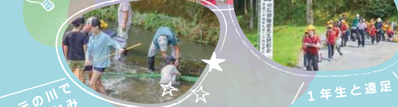
地元の川でアユつかみ