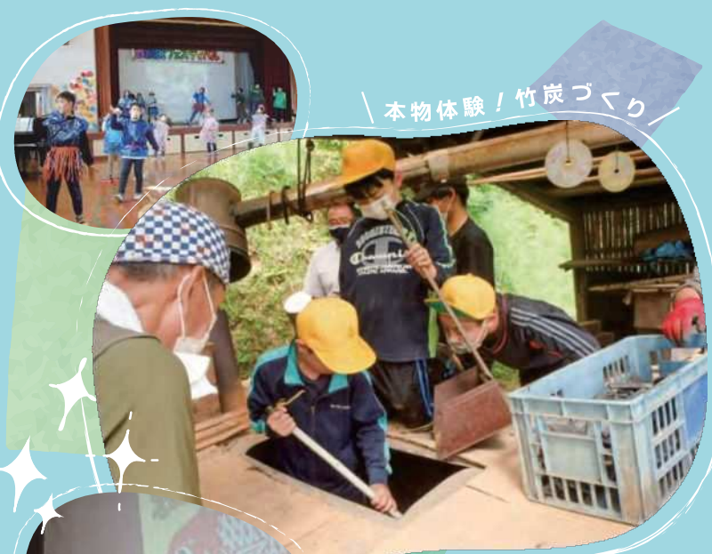
本物体験! 竹炭づくり