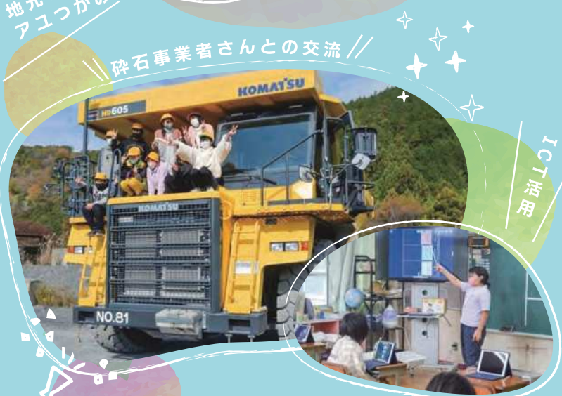
砕石事業者さんとの交流