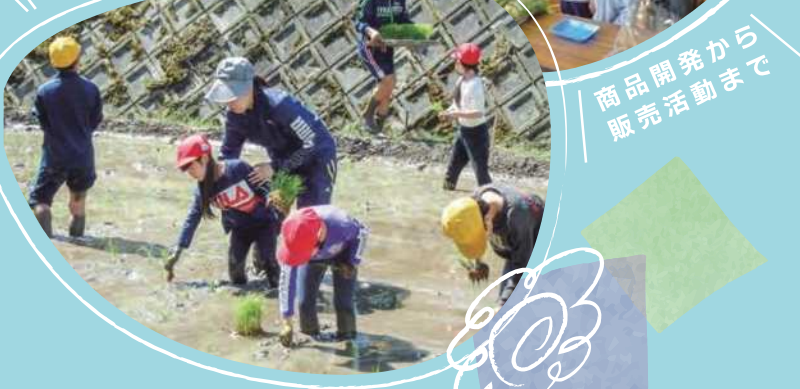
商品開発から販売活動まで