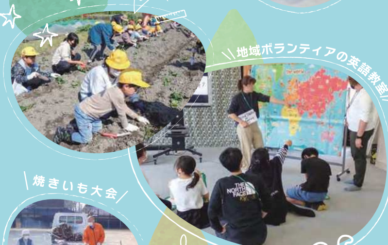
地域ボランティアの英語教室