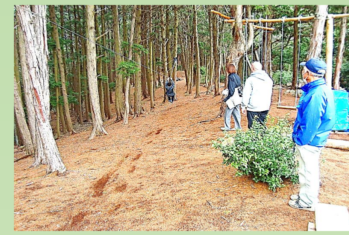
ジップラインでウァ〜