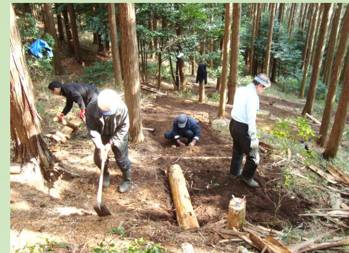
天満宮の登り道を階段へ