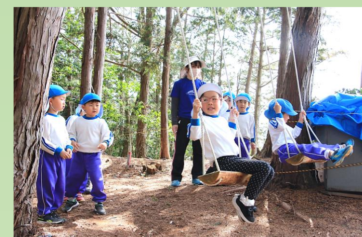
ブランコで順番待ち