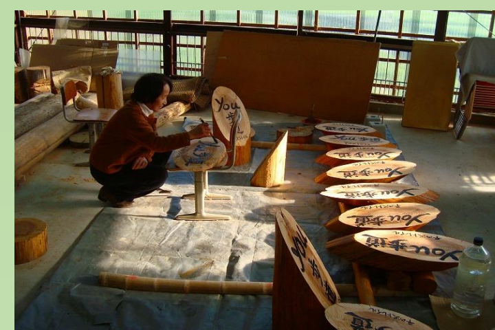
書道の先生 頑張るウ〜。