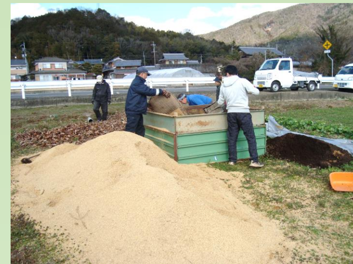
落葉樹で堆肥づくり