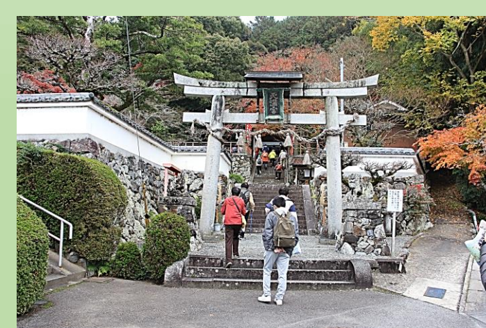
池尻天満宮に参拝後に展望台へ