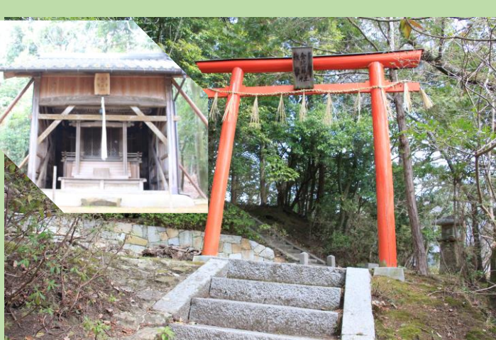
多賀神社に参拝して