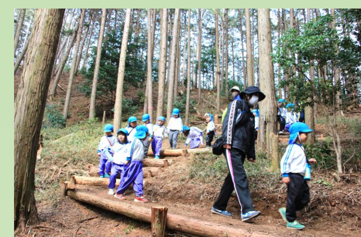
天満宮へ帰り道の園児