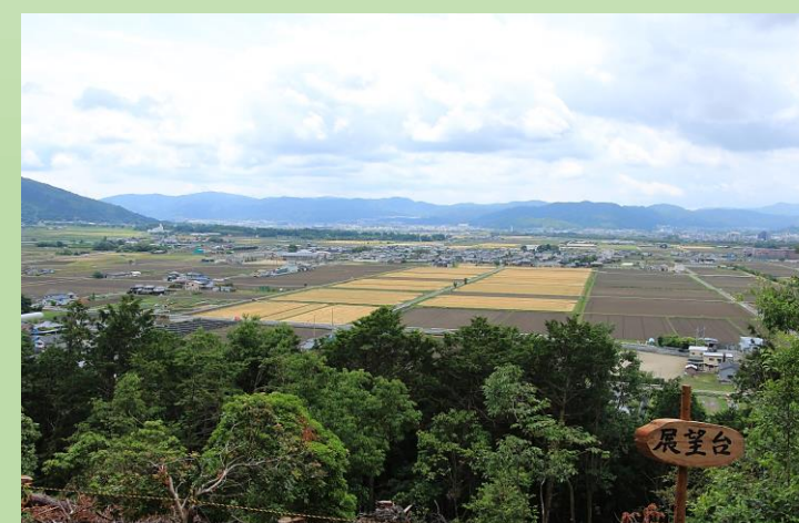
展望台からの風景

平の沢トレイル への問い合わせは 携帯 080-9586-7368着信用 馬路町自治会 (tel22-0661)