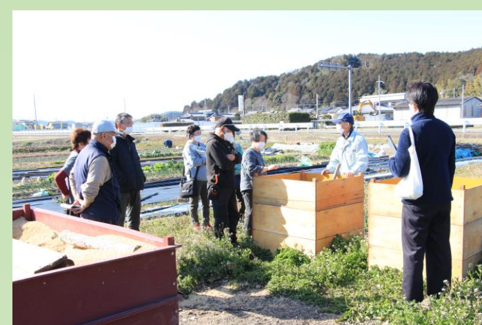
堆肥づくりの講習会