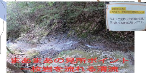
赤あまあの見所ポイント 一枚岩を流れる清流