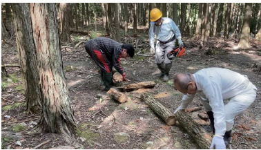
薪、柴を持ち帰り活用します