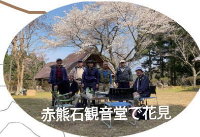
赤熊石観音堂で花見