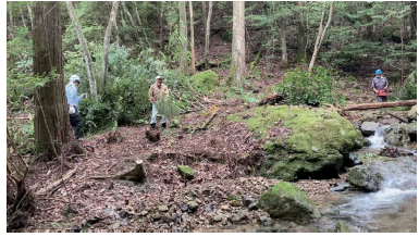
音羽川溪流の雑木伐採作業をして 登山道が明るくなりました