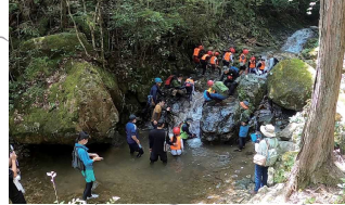
夏場は多くの方に沢登り等楽しんで頂きました