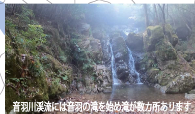
音羽川溪流には音羽の滝を始め滝が数力あります