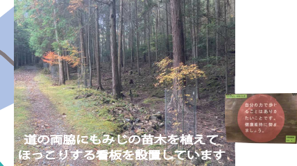
道の両脇にもみじの苗木を植えて ほっこりする看板を設置しています