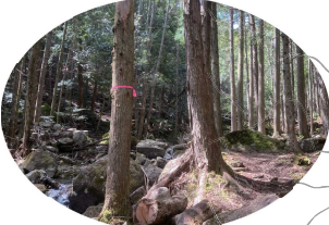
迷わないようにピンクリボンの取付