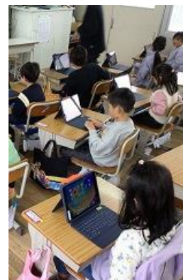
【タブレット操作を練習する1年生】

しかし、ルールを守らず、だらだらと長時間使用すると学力が低下すると国際的なデータも出ています。子どもたちの力につながるアイテムになるよう学校でも声かけをしていきます。ご家庭でもルールを守る声かけにご協力をお願いします。