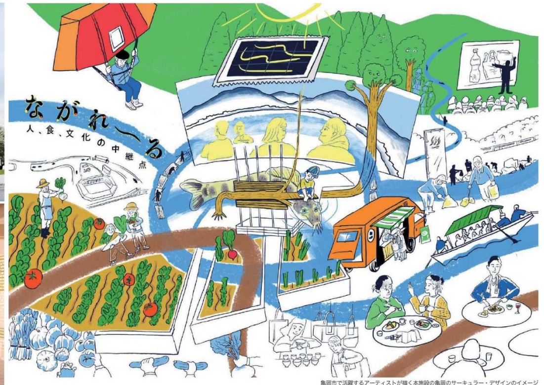
亀岡市で活躍するアーティストが描く本施設の亀岡のサーキュラー・デザインのイメージ