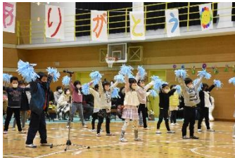
1年生 そうじの思い出!

2月22日に、6年生を送る会を予定通り実施することができました。今まで曾我部小学校のみんなのために頑張ってくれた6年生に呼びかけや歌などを通して、感謝の気持ちを伝えました。6年生も小学校生活を振り返りながら、思いを込めて発表しました。体育館には、総合司会などを勤めてくれた5年生と卒業する6年生、そして6年生の保護者の方々が入り、1から4年生は発表の時以外は、各教室でリモートにて体育館の様子を見ていました。笑いあり涙ありの6年生を送る会は、どの学年にとっても、すてきな思い出になりました。この送る会の成功は、本番まで一生懸命頑張ってきてくれた5年生のおかげです。心温まる送る会を本当にありがとうございました。最高学年のバトンは、5年生に受け継がれました。