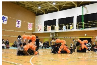
3年生 体育発表会の思い出!