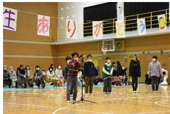
5年生 委員会の思い出!