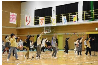
2年生なかよし班の思い出!