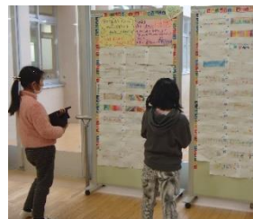
タブレットで投票する子どもたち、 145 人が投票!