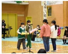
6年生から5年生へ引き継ぐバトン!