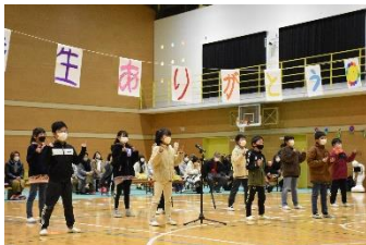
4年生クラブ・登下校の思い出!