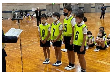
亀岡市自転車大会 2位