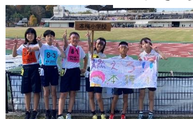
京都丹波キッズふれあい駅伝