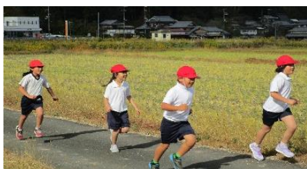
校内マラソン大会